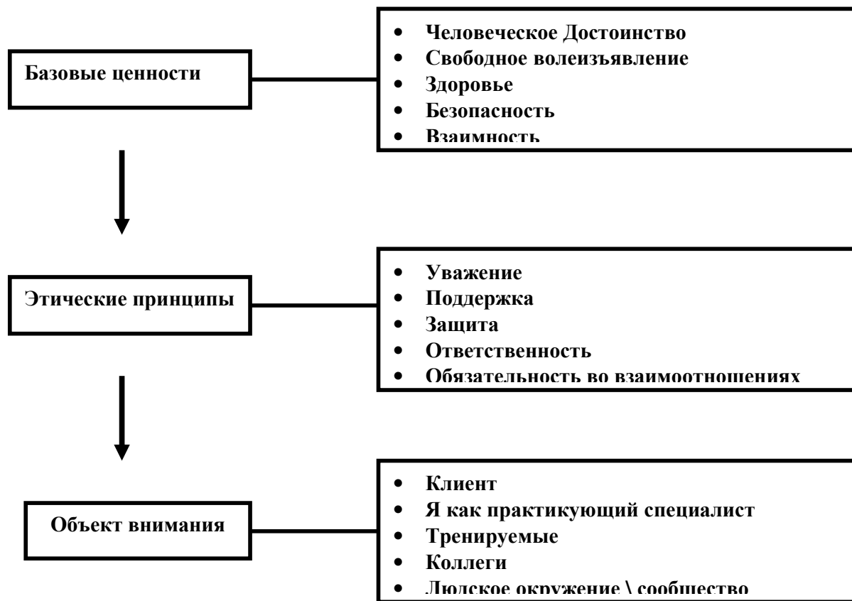
Рис. 1 Синтез основ этического кодекса: три уровня анализа деятельности с точки зрения этики.