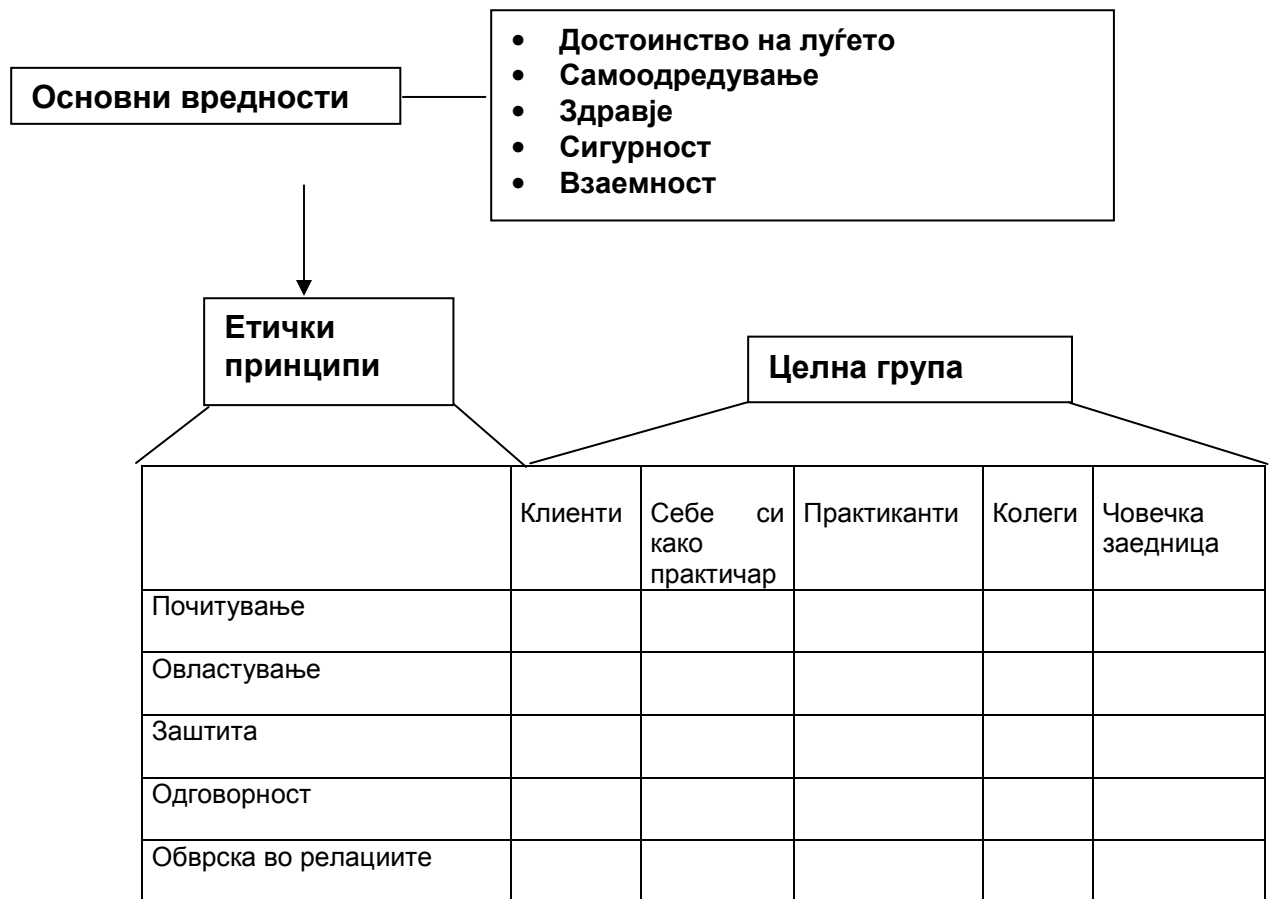
Сл. 2. Упатство за етичка процена

Само по точна процена на ситуацијата од различни гледишта на ТА, практичарот доаѓа до решение.